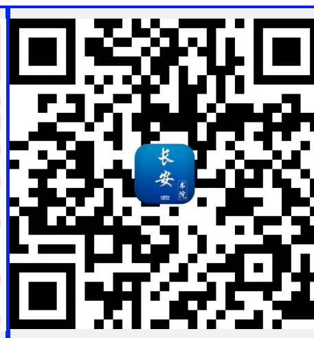
中国教育电视台长安书院APP